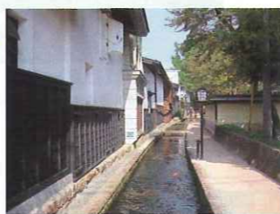
飛騨市【瀬戸川と白壁土蔵街】 約400年前に増島城の濠の水を利用して造られた瀬戸川は、造り酒屋や民家の白壁土蔵とお寺の石垣を背景に色とりどりの約1,000匹の鯉が泳ぐ城下町飛騨古川を代表する観光スポット。