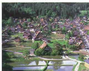
白川村【白川郷合掌造り集落】 雪峰白山の山懐に抱かれる静かな山里に佇む世界遺産白川郷合掌造り集落。合掌造りを間近で堪能しながら古人の知恵を学べます。